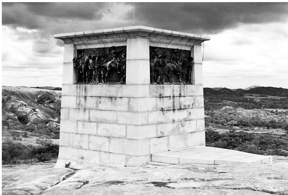
The Shangani Memorial