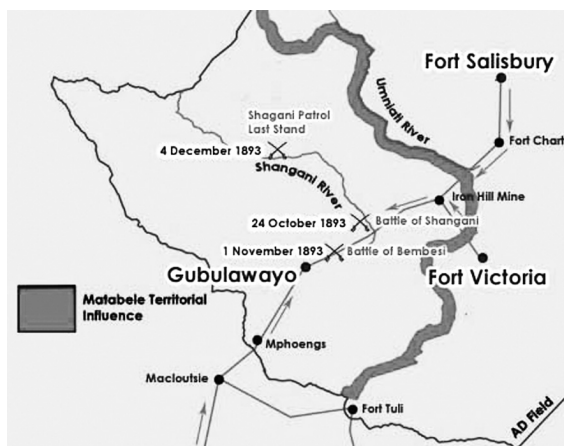
Mapa działań zbrojnych z 1893 r.