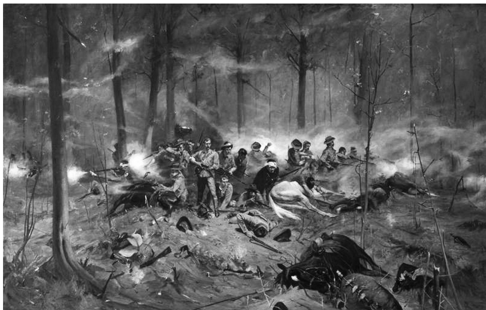
Obraz Allana Stewarta pt.: “There were no survivors” z 1896 r.